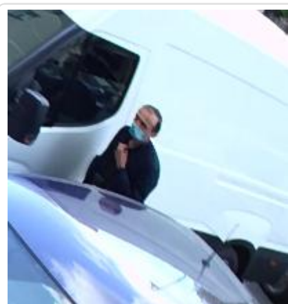
Mężczyzna podejrzewany o kradzież przedmiotów z samochodu nr.sprawy KRP-PM-I-2604/20