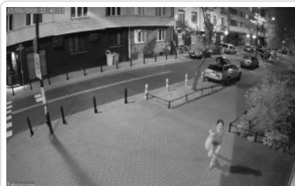
Kobieta podejrzewana o kradzież przedmiotów z samochodu nr.sprawy KRP-PM-I-/20