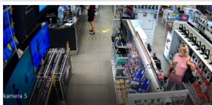
Kobieta podejrzewana o kradzież słuchawek nr.sprawy KRP-D-V-4655/20