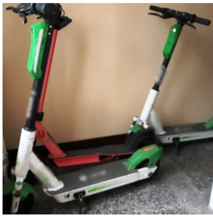
Zabezpieżone przez policjantów przedmioty pochodzące z przestępstwa