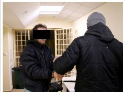
Mężczyzna podejrzany o kradzież