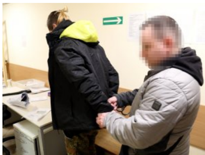
Mężczyzna podejrzany o kradzież