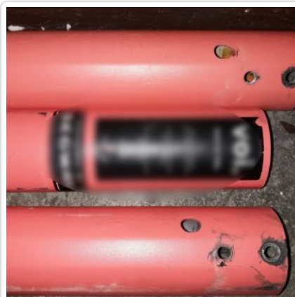
Zabezpieczone przez policjantów przedmioty pochodzące z przestępstwa