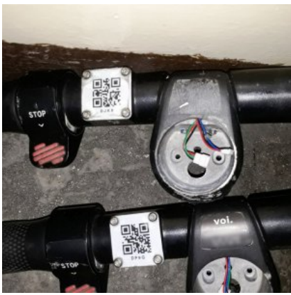
Zabezpieżone przez policjantów przedmioty pochodzące z przestępstwa