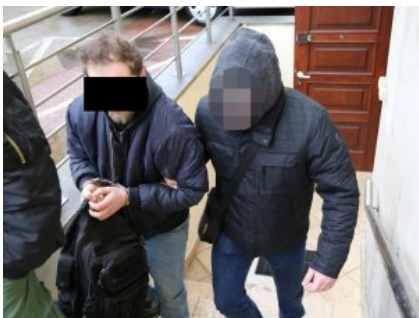
Mężczyzna podejrzany o kradzież