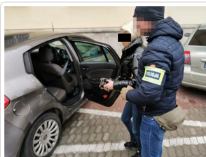
Zatrzymana kobieta podejrzana o kradzież mieszkaniowe