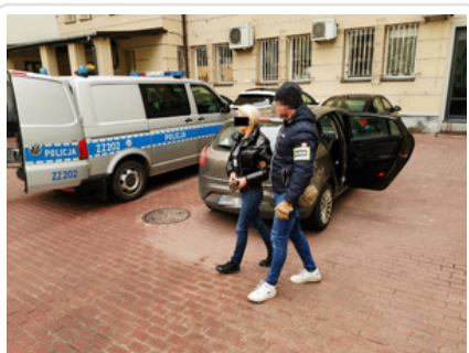
Zatrzymana kobieta podejrzana o kradzież mieszkaniowe