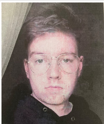
Mężczyzna podejrzewany o oszustwo nr. sprawy KRP-PG-I-178/23/PC