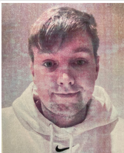
Mężczyzna podejrzewany o oszustwo nr. sprawy KRP-PG-I-178/23/PC