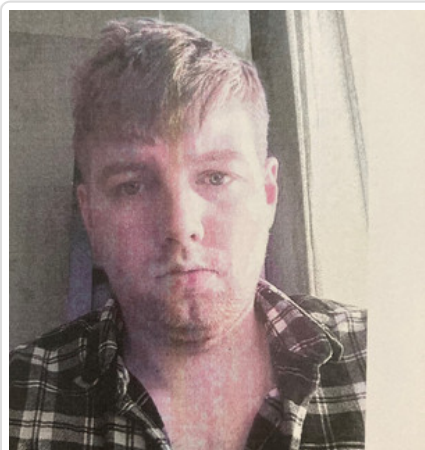
Mężczyzna podejrzewany o oszustwo nr. sprawy KRP-PG-I-178/23/PC