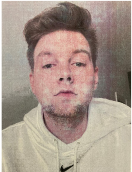
Mężczyzna podejrzewany o oszustwo nr. sprawy KRP-PG-I-178/23/PC