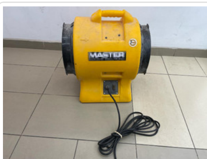
Odzyskane przez policjantów skradzione mienie