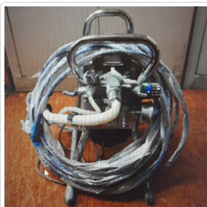
Odzyskane przez policjantów skradzione mienie