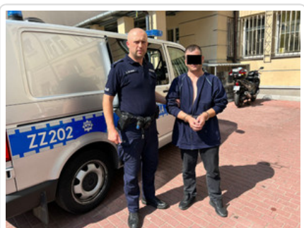
Mężczyzna podejrzany o kradzież kieszonkową