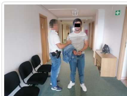
Mężczyzna podejrzany o kradzież kieszonkową