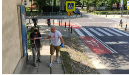
Mężczyzna podejrzany o przestępstwa przeciwko mieniu