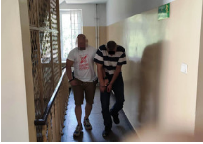
Mężczyzna podejrzany o przestępstwa przeciwko mieniu