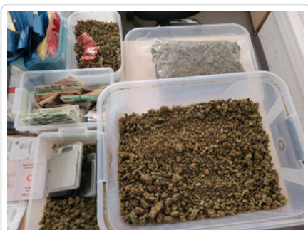
Zabezpieczone przez policjantów pieniądze i narkotyki