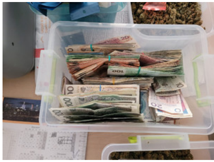
Zabezpieczone przez policjantów pieniądze