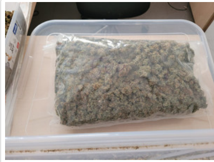
Zabezpieczone przez policjantów narkotyki