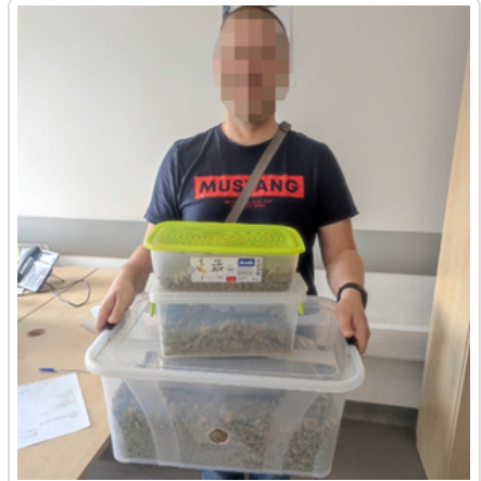
Zabezpieczone przez policjantów pieniądze i narkotyki