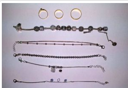
Odzyskana przez policjantów biżuteria