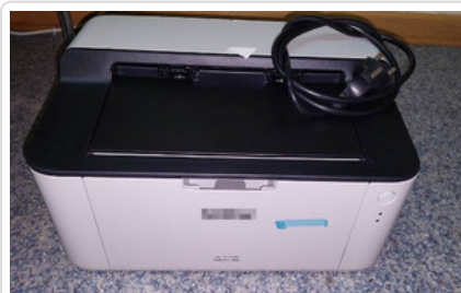
Odzyskana przez policjantów drukarka