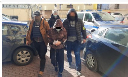
Mężczyzna podejrzany o usiłowanie zabójstwa