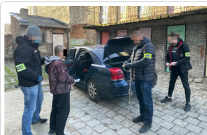
Mężczyzna podejrzany o usiłowanie zabójstwa