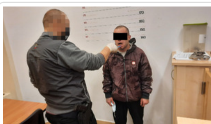
Mężczyzna podejrzany o usiłowanie zabójstwa

Film Atakując mógł zabić, został już zatrzymany i tymczasowo aresztowany