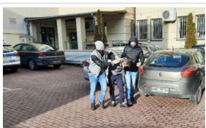
Mężczyzna podejrzany o kradzież i posiadanie narkotyków