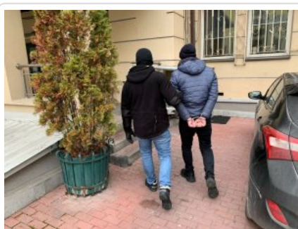
Mężczyzna podejrzany o kradzież kieszonkową