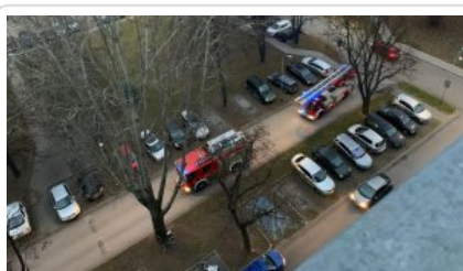
Interwencja straży pożarnej