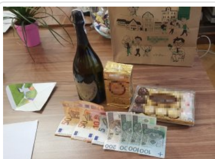
Zabezpieczone przez policjantów przedmioty i pieniądze

Policjanci ze śródmiejskiego wydziału do walki z przestępczością gospodarczą zatrzymali kobietę podejrzaną o wręczenie korzyści majątkowej osobie publicznej. 54-lątka chciała wpłynąć w ten sposób na faworyzowanie swojego syna przez nauczycieli i zaliczenie mu zaległych prac z poprzedniej szkoły. Za to przestępstwo kodeks karny przewiduje do 2 lat pozbawienia wolności.