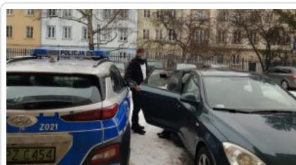
Kobieta zatrzymana za wręczenie korzyści majątkowej

Do czego może doprowadzić źle pojęta nadopiekuńczość rodzica pokazała historia, która wydarzyła się w jednej ze stołecznych szkół podstawowych. Do pokoju dyrektora placówki z nietypową prośbą przyszła mama ucznia. Kobieta zwróciła się z prośbą o zaliczenie swojemu synowi zaległych prac z poprzedniej szkoły oraz wystawianie mu przez nauczycieli lepszych niż dotychczas ocen.